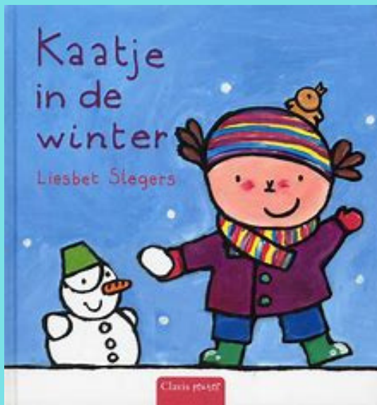
Kaatje in de winter Liesbet Slegers