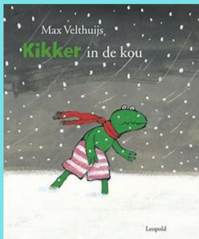
Kikker in de kou Max Velthuis